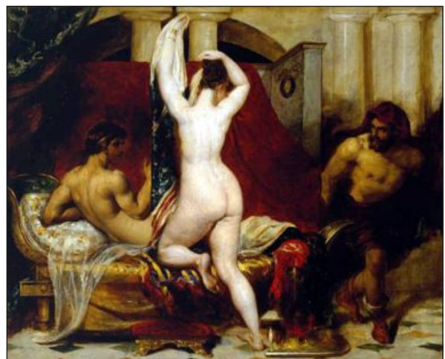
12 pav. William Etty (1787–1849 m.). Lydijos karalius Kandaules slapčia rodo tarnui Gygui savo žmoną, einančią gulti (1820).

Midas (738–696 m. pr. Kr.) – Frygijos karalius. Pagal graikų legendą, Midas paprašė dievo Dioniso padaryti taip, kad viskas, prie ko prisilies karalius, pavirstų į auksą. Godumas vos nepražudė Mido, kadangi net maistas pa-