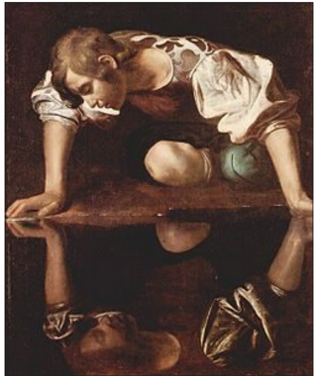
13 pav. Michelangelo Merisi da Caravaggio (1571–1610 m.). Narcizas (1599).

Nacionalinė antikinio meno galerija, Roma.