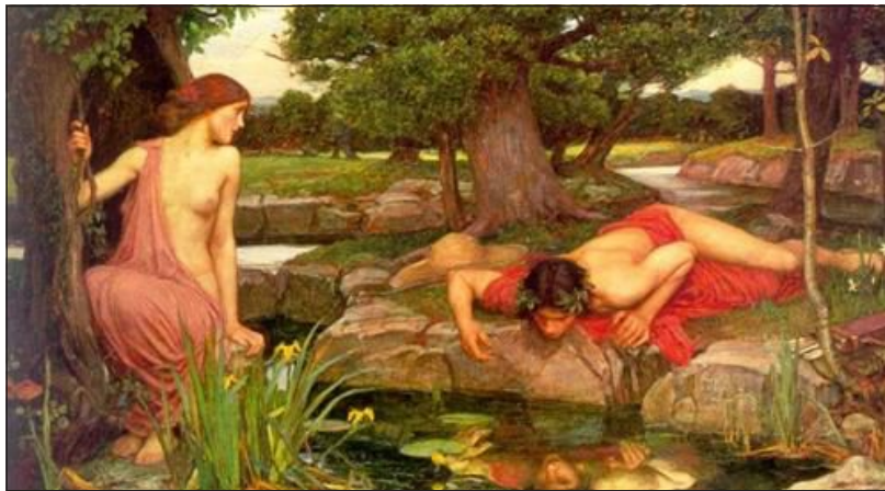
14 pav. John William Waterhouse (1849–1917 m.). Echo ir Narcizas (1903). Volkerio meno galerija, Liverpulius, Didžioji Britanija.

Mitą apie narcizą savo kūriniuose vaizdavo garsūs dailininkai: Caravaggio (1571–1610 m.), Nicolas Poussin (1594–1665 m.), John William Waterhouse (1849–1917 m.), Salvator Dalí (1904–1989 m.) ir kt.