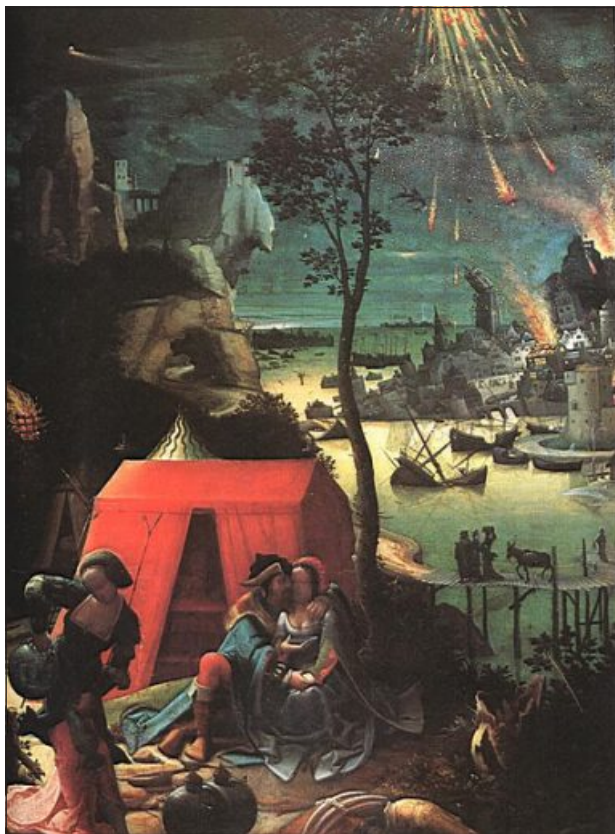
10 pav. Lucas van Leyden (1490–1533 m.). Lotas ir jo dukterys (1509).