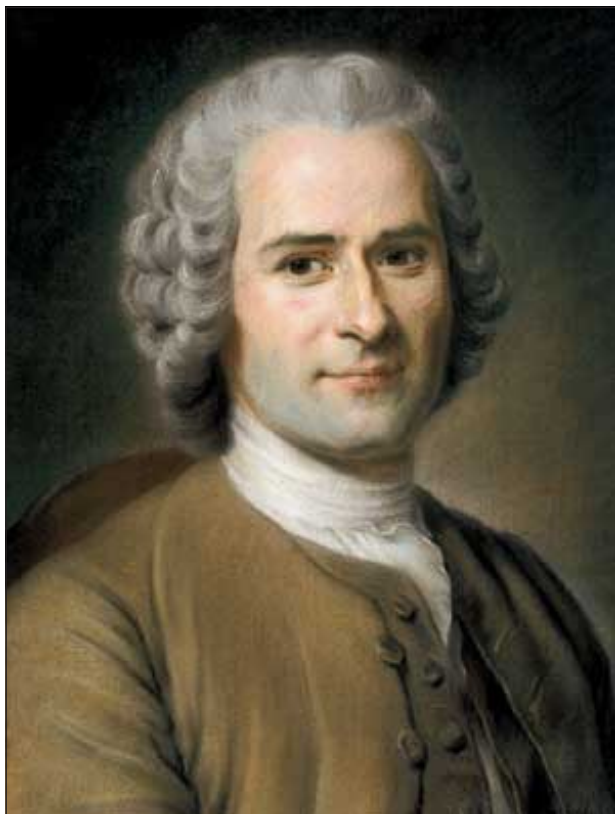
6 pav. Maurice-Quentin La Tour (1704–1788 m.). Jean-Jacques Rousseau portretas (1753).

Jean-Jacques Rousseau muziejus, Monmorancy, Prancūzija.