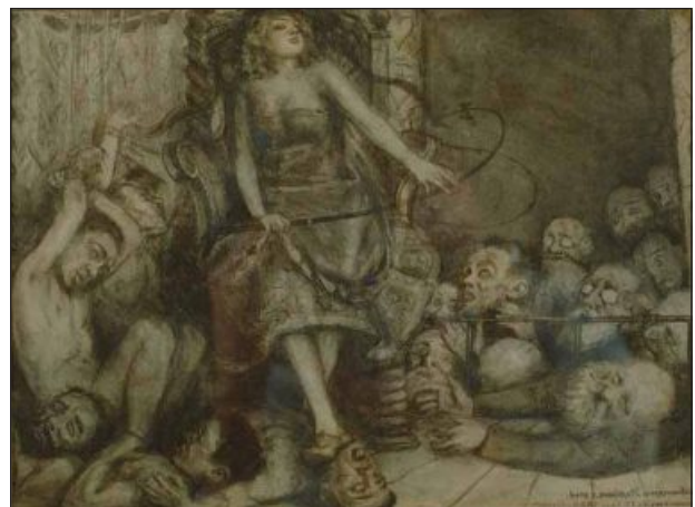
5 pav. Bruno Szulz (1892–1942 m.). Mazochistinė scena (1926).

Sadistinis ir mazochistinis elgesys buvo žinomas dar prieš Krafft-Ebing. Mazochizmo reiškinys tuomet dar nebuvo moksliskai ištirtas. 1498 m. italų filosofas Giovanni Pico della Mirandola (1463–1494 m.) aprašė vyrą, kuris norėjo būti plakamas prieš lytinius santykius. 1639 m. vokiečių gydytojas Johann Heinrich Meibom (1590–1655 m.) sukūrė pirmąją mazochizmo teoriją: remdamasis tuometinėmis anatomijos žiniomis, jis teigė, kad sėdmenų plakimas sušildo inkstuose spermą, kuriai pasiekus sėklides, kyla seksualinis susijaudinimas. Šią teoriją