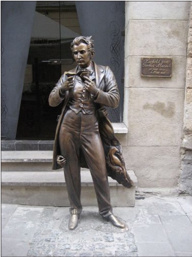
8 pav. Leopold von Sacher-Masoch paminklas Lvove.

15 tūkst. dolerių. Lvove jau yra paminklai šaliajam kareiviui Šveikui ir besišlapinančiam šuniukui [17]. Kaip čia neprisiminsi, kad Vilniuje jau yra paminklai, susiję su literatūra – garsiam gydytojui Cemachui Šabadui („daktarui Aiskaudai“) ir Romainui Gary.