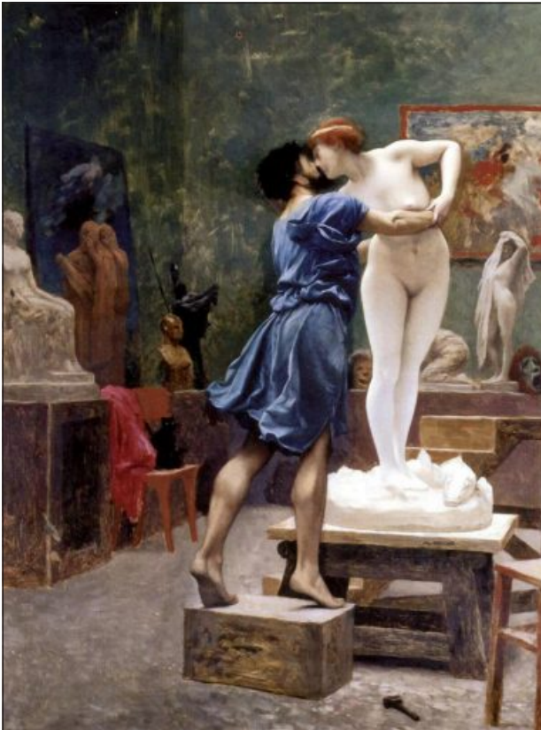
11 pav. Jean-Léon Gérôme (1824–1904 m.). Pigmalionas ir Galatėja (1890).