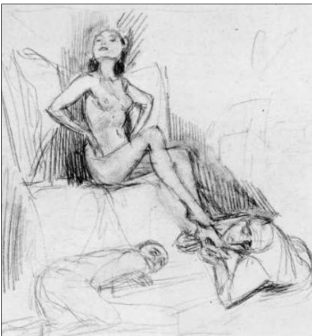
4 pav. Bruno Szulz (1892–1942 m.). Du vyrai prie nuogos moters kojų (1933).

Sadizmo ir paties markizo de Sado temai paskirta daug literatūros tyrinėjimų, pjesių, meninių filmų. Apie tai rašė garsūs psichiatrai. Krafft-Ebing savo knygoje paminėjo psichiškai nesveiko rašytojo Henrich von Kleist (1777–1811 m.) dramą „Pentesilėja“. Rašytoja feministė, filosofė Simona de Bovuar (Simone de Beauvoir), Jean-Paul Sartre žmona, 1951–1952 m. parašė esė „Ar mes turime sudeginti Sadą?“. 1963 m. vokiečių rašytojas ir dailininkas Peter Weiss (1916–1982 m.) parašė pjesę „Marat/Sade“, kurioje markizas de Sadas Šarantono (Charenton) psichiatrijos ligoninėje stato pjesę apie Prancūzijos revoliucionieriaus Marato nužudymą. Pagal pjesę 1967 m. pastatytas filmas (rež. P. Brook). Pagal markizo de Sado romaną „Salo, arba 120 Sodomos dienų“ 1975 m. pastatytas to paties pavadinimo filmas (rež. Paolo Pasolini). Kitas populiarus meninis filmas – „Skandalingoji plunksna“ (2000 m., rež. Ph. Kaufman).