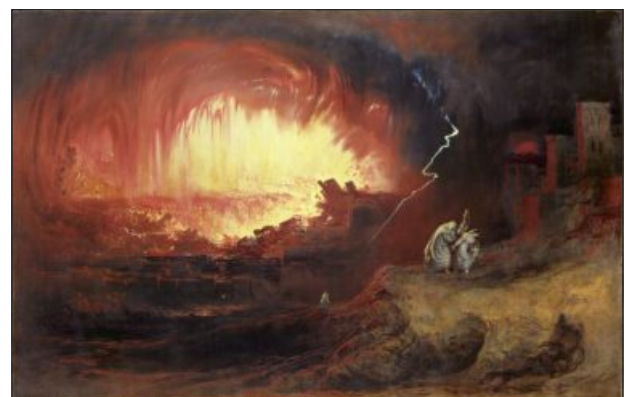
9 pav. John Martin (1789–1854 m.). Sodomos ir Gomoros žlugimas (1852).

Plačiąja prasme sodomija vadinamas smerktinas seksualinis elgesys, rečiau – netvarka, chaosas. Kai kuriose Europos šalyse terminas seniau buvo vartojamas bažnytinėje ir baudžiamojoje teisėje. Pagal Krafft-Ebing, juristai